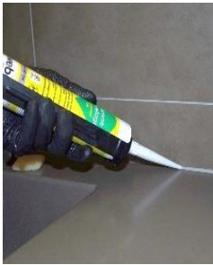
Figure 1. Application mastic

Dans le monde de la construction et de la rénovation des bâtiments, le collage est une méthode à la fois universelle car appliquée à une grande diversité de matériaux et structures, et à la fois complexe car elle met en jeu chimie des polymères, propriétés des interfaces et mécanique de la rupture. Les adhésifs ou mastics utilisés dans la construction présentent en effet une grande diversité de chimies et de formulations : silicones, acryliques, polyuréthanes, polymères hybrides. Les substrats à coller peuvent être en métal, en ciment, en céramique, en bois. Le comportement mécanique de ces mastics et adhésifs diffèrent fortement de ceux généralement utilisés pour la réalisation d'assemblages structuraux pour lesquels est demandé une grande reproductibilité de comportement une rigidité et une résistance mécanique importante. En effet, silicone, polyuréthane etc ... sont des matériaux présentant un fort allongement à rupture, un comportement fortement non linéaire mais comme nombre d'élastomère se révèlent